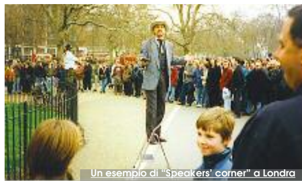
Un esempio di "Speakers' corner" a Londra

2018- All'interno del Primo City Forum promosso dall'A.C. di Trapani con il Tavolo Permanente delle Professioni Tecniche dello scorso dicembre, il contributo dell'Ordine degli Architetti P.P.C. di Trapani, ha evidenziato l'enorme patrimonio edilizio pubblico caratterizzato da immobili storici di pregio (Lazzaretto, Colombaia, San Domenico, Villino Nasi, Mura di Tramontana, Ospedale Marino, Bastione dell'impossibile, solo per citare alcuni) che rappresentano l'opportunità di un intervento di grande rilevanza culturale. Pensiamo a questi contenitori culturali dedicati alle opere dei trapanesi illustri quali, Leonardo Ximenes (Trapani 1716 - Firenze 1786, sommo idraulico trapanese, astronomo e geografo italiano di grande rilievo, cui la Toscana rende ancora oggi omaggio), Carla Accardi (artista nata a