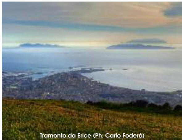
Tramonto da Erice

Ancora oggi è in uso, nelle democrazie anglosassoni, che un narratore improvvisato sale su una cassetta di frutta nei giardini pubblici e inizia a raccontare le cose che gli passano per la testa.