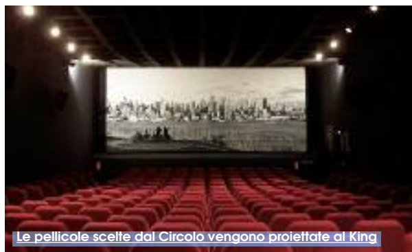
Le pellicole scelte dal Circolo vengono proiettate al King

Necessaria, perché il cinema d'autore è indiscutibilmente un mezzo di rappresentazione e approfondimento culturale che spesso, però, deve fare i conti con esigenze di tipo commerciale. Nulla di nuovo per i cinefili come noi, costretti, talvolta, a dover rinunciare alla visione in sala, perché non proiettato. Scelta quest'ultima della casa editrice, che è anche il proprietario - distribu-